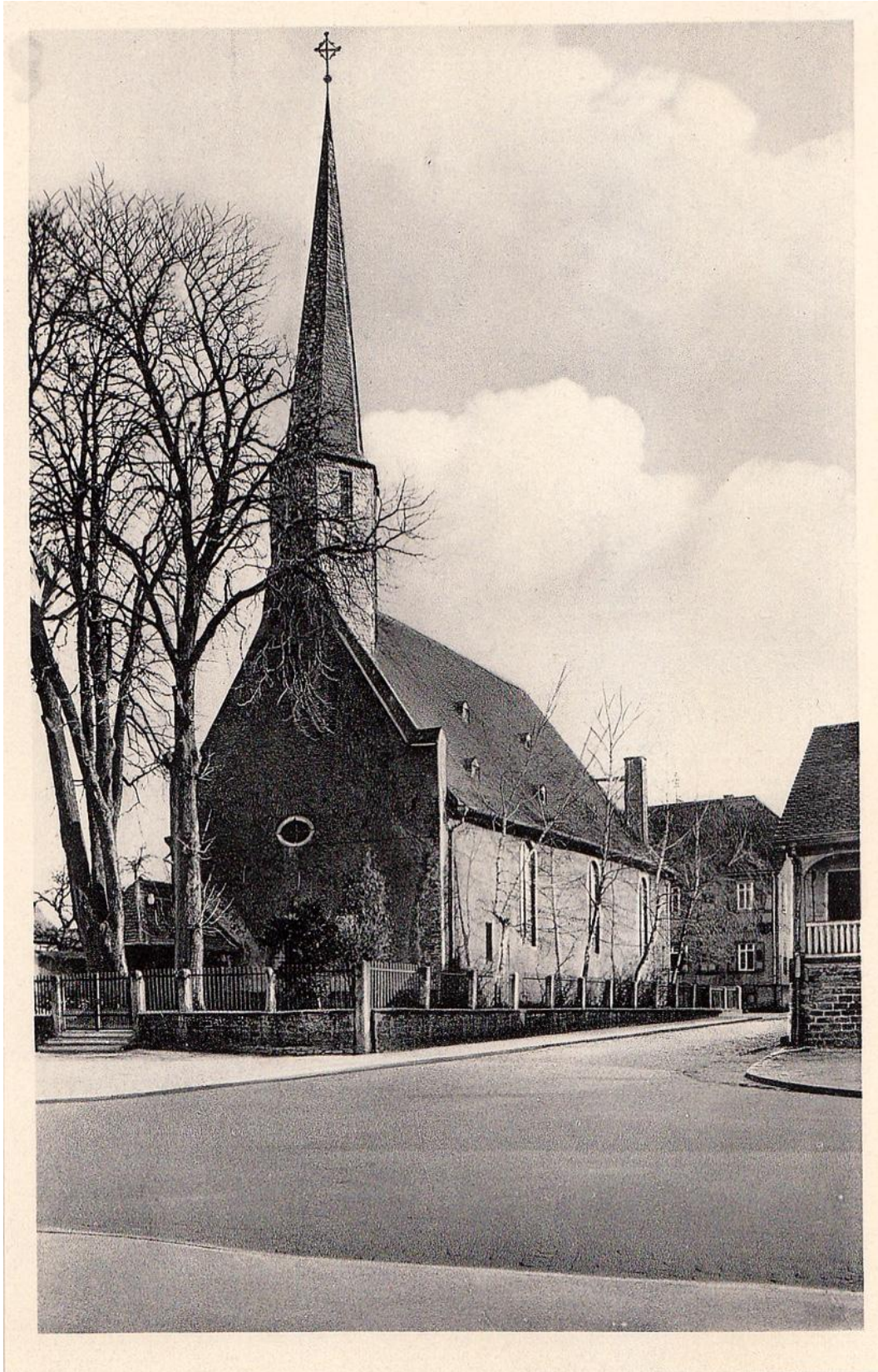
Bild "Kirche alt": Das historische Postkartenfoto der Egelsbacher Kirche ist vor 1957 entstanden, denn in diesem Jahr wurden die beiden Kastanienbäume am Treppenaufgang gefällt. Auf der Rückseite ist vermerkt: "Spendenkarte zum Besten der Erbauung eines ev. Gemeindehauses".