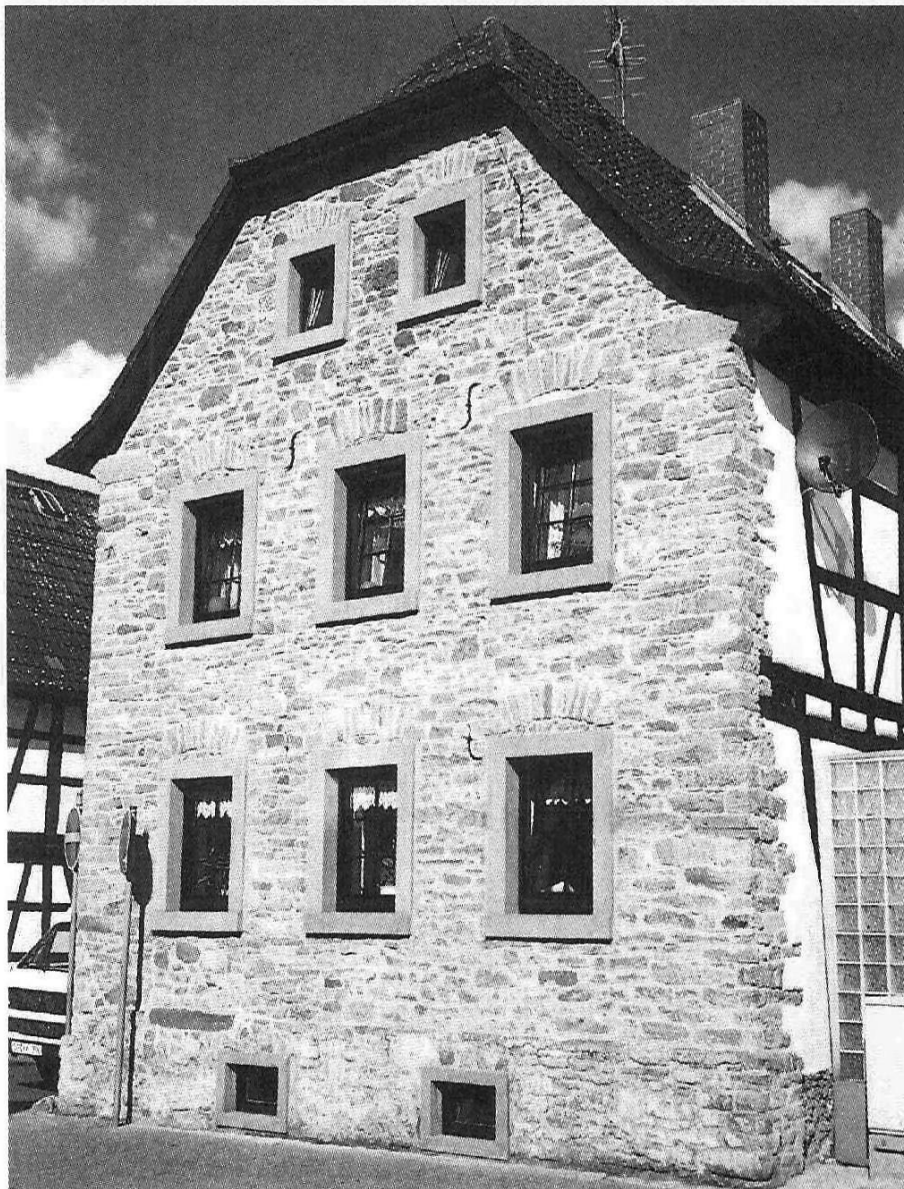
Freigelegte Bruchsteinfassade Fachwerkhaus Ernst-Ludwig-Straße 66